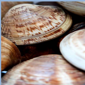
La Vongola di Goro