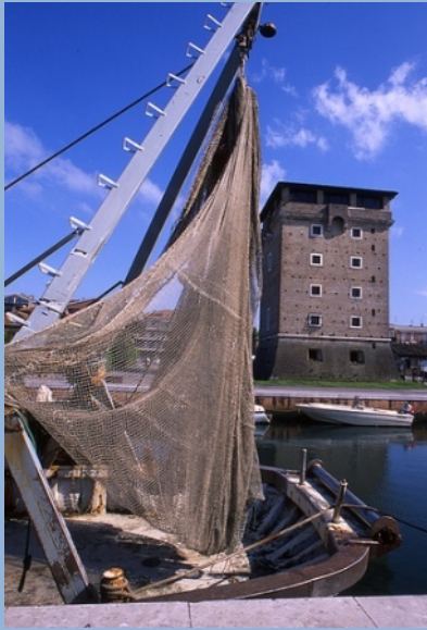
Cervia Torre del Magazzini del Sale