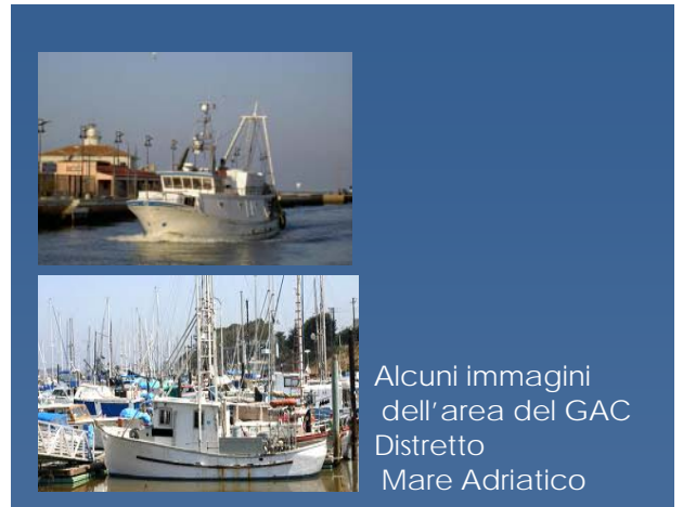
Alcuni immagini dell'area del GAC Distretto Mare Adriatico

Il GAC associa al 30% soggetti pubblici, ovvero le Province di Ferrara e Ravenna, i Comuni di Goro, Comacchio, Ravenna e Cervia, le CCIAA dei due territori e il Parco del Delta del Po; per il 40% soggetti in rappresentanza del settore della pesca e dell'acquacoltura quali associazioni, O.P, imprese e consorzi del settore ittico e per il restante 30%, raggruppa altre categorie economiche che operano negli altri settori economici ambientali connessi.