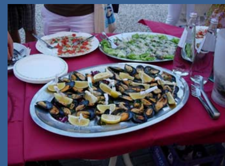
Alcuni immagini dell'area del GAC Distretto Mare Adriatico