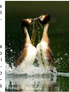
Immagine di G. Sala

A partire dal 1° aprile, sono state infatti organizzate escursioni a piedi o in bicicletta in luoghi davvero unici da un punto di vista ambientale e della biodiversità, come le Valli di Comacchio, le Saline , per scoprire i luoghi, i sapori, le tradizioni e le infinite sfaccettature del Parco del Delta del Po Emilia-Romagna, con centinaia di iniziative aperte ad adulti e bambini nei siti naturalistici più belli del Parco tra Ferrara e Ravenna. A partire dal 1° aprile, sono state infatti organizzate escursioni a piedi o in bicicletta in luoghi davvero unici da un punto di vista ambientale e della biodiversità, come le Valli di Comacchio, le Saline, la Valle della Canna, l'Oasi