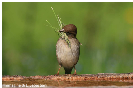
Immagine di L. Sebastiani

Secondo una stima fornita da Lipu, in Italia gli appassionati di birdwatching sono da sei a settemila, senza contare i cosiddetti “osservatori occasionali”, ovvero coloro che arrivano nelle oasi e nelle riserve senza lo scopo preciso di praticare birdwatching , ma che poi decidono di partecipare ad un'osservazione guidata, che sono circa 20.000. Si tratta quindi di un mercato turistico in crescita e che in potenza è stimato in circa 2 milioni di persone , come dimostrano i dati relativi all'ecoturismo, che contano circa 15 milioni di persone in Italia, di cui quasi un terzo stranieri. Per tutti questi motivi, importante e molto atteso, nel fine settimana dal 30 aprile al 2 maggio, il ritorno della V edizione della Fiera Internazionale del Birdwatching e del Turismo Naturalistico di Comacchio (Fe), un villaggio espositivo dedicato agli esperti di birdwatching e fotografia naturalistica, con convegni, workshop, mostre fotografiche e documentari naturalistici. L'evento, che anche quest'anno ha registrato un boom di presenze con oltre 22.000 visitatori, si