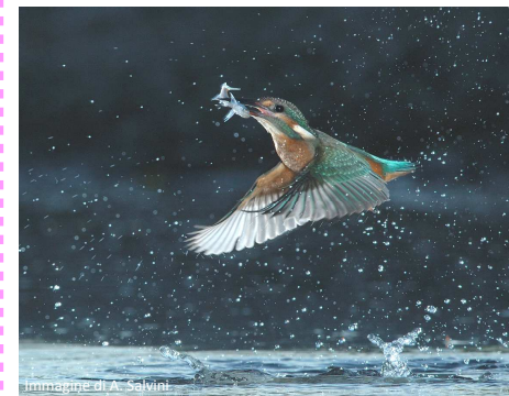
Immagine di A. Salvini