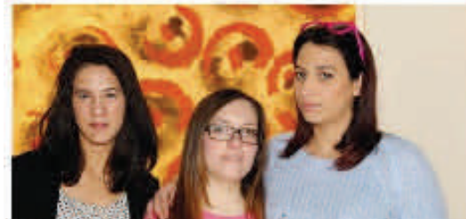
La 3ª A dell'PSIA di Argenta

Ferrara e Ravenna, coinvolgendo 2300 studenti in un percorso di oltre 300 incontri nelle classi e più di 50 uscite presso le aziende green del territorio. Gli elaborati pervenuti al Gal per la partecipazione al concorso Diventa Classe Green sono stati 23; l'apposita commissione ha selezionato i 6 finalisti che ieri hanno presentato i loro progetti, alla presenza del sindaco di Comacchio, Marco Fabbri, del presidente del Gal Delta 2000 Lorenzo Marchesini e di Patrizio Bianchi, assessore alla Scuola della Regione Emilia-Romagna.