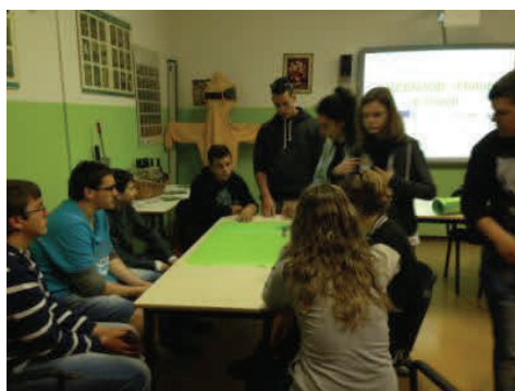
Gli studenti in visita a Mater Naturae (foto sopra) e in visita a Vin-yloop (foto sotto)

Si sono così raggiunte oltre 100 classi per un totale di oltre 2000 studenti partecipanti