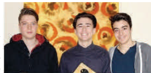
La 2ª B del Liceo Copernico - Carpeggiani di Ferrara

che hanno reso gli studenti protagonisti entusiastici dei lavori presentati. Un percorso che in futuro potrà estendersi ad altre scuole e che potrà anche svilupparsi stimolando i giovani a trasformare l'idea creativa in un'idea di vera e propria impresa.