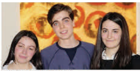
La 2ª E del Liceo Scientifico di Ravenna