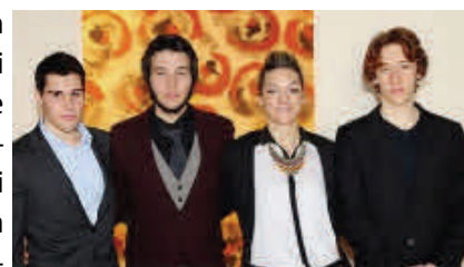
La 5ª B del Liceo Carducci di Ferrara