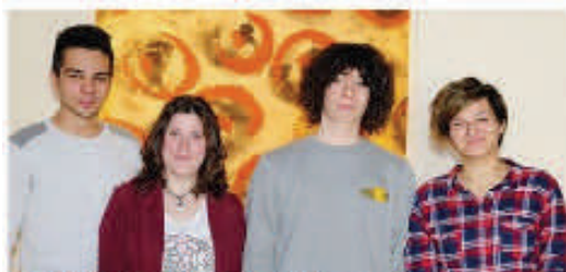
La 2ª B dell'Istituto tecnico per Geometri di Ravenna