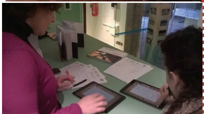
Alcune immagini delle inaugurazioni nei musei del Delta