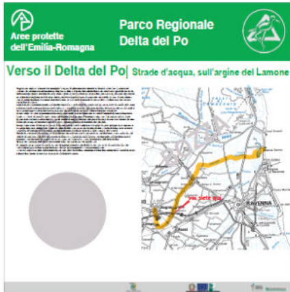
Pannello LATO 'A'