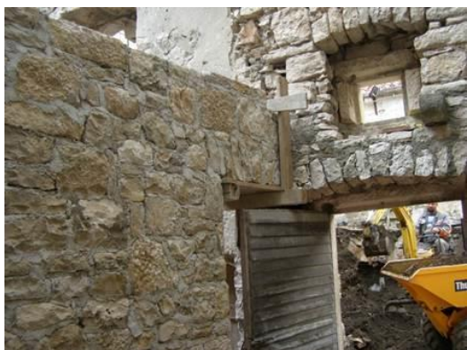
Restauro della Casa di Marco Polo a Korčula

I testi verranno scansionati, digitalizzati ed illustrati per poi essere raccolti all'interno di una piattaforma informatica a disposizione degli utenti, sia da remoto via web, sia tramite una postazione informatica installata direttamente all'interno del centro visitatori. Questo grande archivio digitale accoglierà inoltre alcune sezioni dedicate alla storia, all'archeologia e al contesto ambientale, di un luogo tra i più visitati della provincia di Ferrara