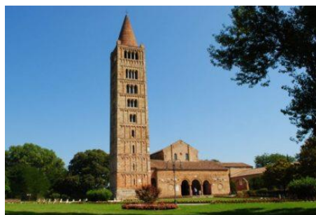
Digitalizzazione dell' archivio storico dell' Abbazia di Pomposa