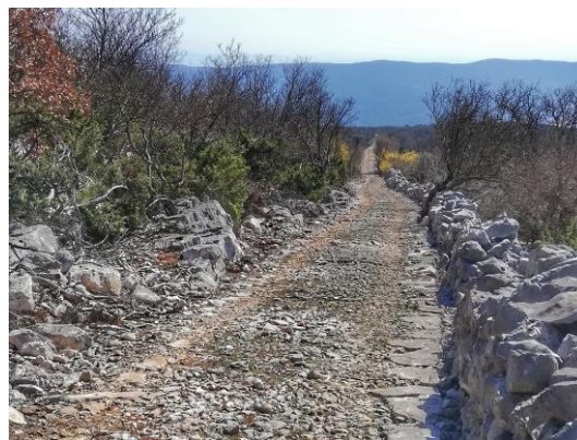
Ripristino della rete dei percorsi storici di Cres

Dopo la completa ricostruzione, la città di Korčula potrà vantare una casa medievale restaurata con uno spazio espositivo che presenterà la storia della vita e dei viaggi di Marco Polo e il collegamento storico tra la città di Korčula e Venezia.