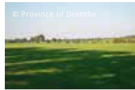
Varietà di paesaggi