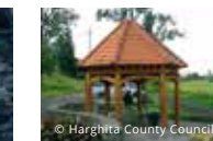
Oltre 2.000 sorgenti di acqua minerale

In passato i boschi coprivano oltre il 35% della superficie della contea, per questo Harghita è da sempre chiamata "terra sempre verde". Il turismo rappresenta una delle principali fonti di reddito del territorio e i relativi servizi e attività connesse contribuiscono alla occupazione locale in modo sostanziale.