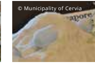
Sale dolce di Cervia

Il territorio del Delta del Po , Patrimonio dell'UNESCO, è l'area con la più grande estensione italiana di zone umide protette. Tra i principali obiettivi, lo sviluppo di un turismo ecosostenibile, attraverso la costruzione di offerte turistiche volte a valorizzare le risorse e potenzialità locali (quali i prodotti tipici, enogastronomia, risorse ambientali - naturalistiche, ecc.), il sostegno alle PMI per migliorarne la competitività e favorire nuova occupazione nei territori rurali.