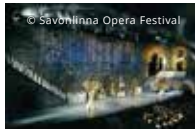
Cultura / Eventi Opera