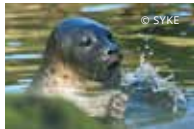
Foca dagli Anelli di Saimaa