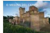
Storia e patrimonio

MEDINA DEL CAMPO È CONOSCIUTA COME LA VILLA DE LAS FERIAS ED È SITUATA NELLA PROVINCIA DI VALLADOLID, REGIONE AUTONOMA DI CASTIGLIA E LEON. LA SUA ECONOMIA SI BASA SOPRATTUTTO SULLA AGRICOLTURA E SULLE INDUSTRIE DI TRASFORMAZIONE E COMMERCIALIZZAZIONE.