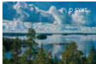
Natura Zona del Lago Saimaa