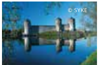
Storia Castello di St. Olav

SAVO MERIDIONALE (ETELÄ-SAVO) È NOTA PER IL SUO PAESAGGIO UNICO, LA PRESENZA DEL LAGO SAIMAA, IL QUARTO PIÙ GRANDE IN EUROPA, CON I SUOI LABIRINTICI ARCIPELAGHI E LA PRESENZA DELLA FOCA DAGLI ANELLI, SPECIE IN VIA DI ESTINZIONE. L'AREA È CONOSCIUTA ANCHE PER LE FORESTE NATURALI E INCONTAMINATE, AMBIENTE PROTETTO E LA DISPONIBILITÀ DI SERVIZI.